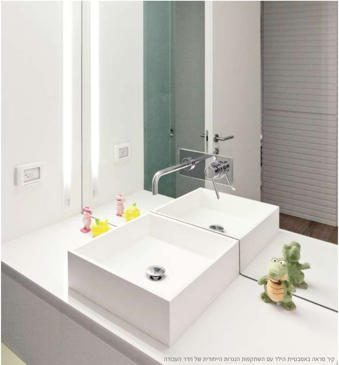
קיר מראה באמבטיית הילד עם השתקפות הנגרות הייחודית של חדר העבודה

צ'ולך מסביר שהייחוד בפרויקט היה לתרגם את שפת הלקוח לשפת המעצבים בצורה ובחומר בחלל הנתון, בלי לוותר על הנגיעה האישית של כל אחד מהם. כתוצאה מכך, לצד הקו המינימליסטי והמודרני, הדירה שהתקבלה עם תום השיפוץ היא חמימה, נעימה ובקנה מידה אנושי. כל אלה הופכים אותה למצע נוסטלגי וביתי שעוטף בחום.